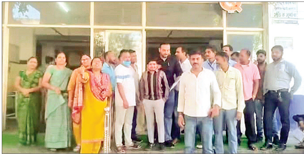
महीनों से वेतन नहीं मिला है। घर चलाना मुश्किल हो गया है, बच्चों की स्कूल फीस से लेकर राशन तक के लाले पड़ रहे हैं। इसके अलावा, पिछले 6 महीनों से उनका पीएफ (प्रोविडेंट फंड) भी उनके खातों में जमा नहीं किया गया है। कर्मचारियों का आरोप है कि सरकारी नियमों की धजियां उड़ाते हुए उनके भविष्य के साथ खिलवाड़ किया जा रहा है। अस्पताल में आउटसोर्सिंग का टेका सिग्मा इन्फोटेक्स कंपनी के पास है। कर्मचारियों ने कंपनी और उसके ठेकेदार पर आरोप लगाए हैं। उनका कहना है कि-

ज्ञापन देने पहुंचे कर्मचारियों ने बताया कि उन्हें पिछले तीन महीने से वेतन नहीं मिला है। घर चलाना मुश्किल हो गया है, बच्चों की स्कूल फीस से लेकर राशन तक के लाले पड़ रहे हैं।