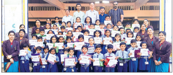
हरिभूमि न्यूज ▶ आष्टा

संस्था मॉडर्न पब्लिक हा.से. स्कूल द्वारा वार्षिक खेल प्रतियोगिता में प्रथम, द्वितीय व तृतीय आने वाले छात्र/छात्राओं को पुरस्कार व प्रमाण पत्र देकर सम्मानित किया। बीते दिनों कई गेम प्रतियोगिता करावाई गई थी। सभी पुरस्कृत प्रतिभागियों को सभी शिक्षकों व शाला के मार्गदर्शक द्वारा भाईदयां दी व बच्चों के उज्ज्वल भविष्य की भी कामना की। प्रतियोगिता में उपस्थित संचालक मंडल व शाला परिवार के मार्ग दर्शक एसएल परमार, केएल