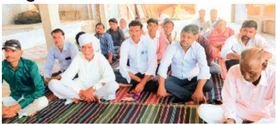
हरिभूमि न्यूज़ ▶▶ माचलपुर

मध्य प्रदेश जन अभियान परिषद योजना आर्थिक सांख्यिकीय के विभाग मध्य प्रदेश शासन जिला राजगढ़ विकासखंड जीरापुर द्वारा चयनित नवांकुर संस्था श्री महावीर