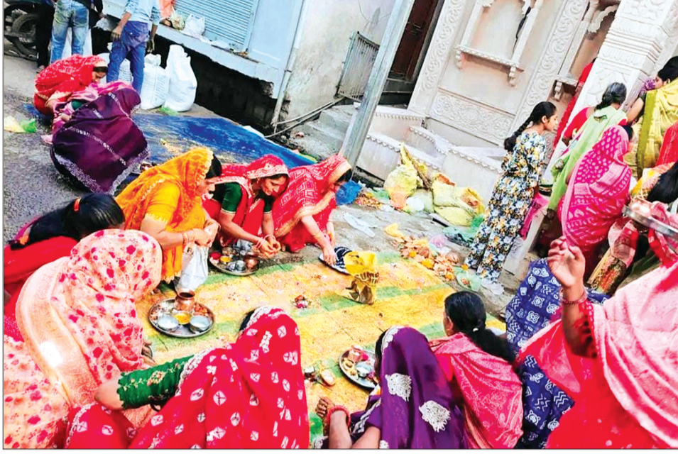
शीतला सप्तमी पर की पूजा-अर्चना