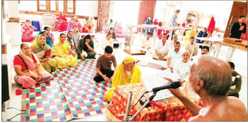
हरिभूमि न्यूज ▶ आष्टा